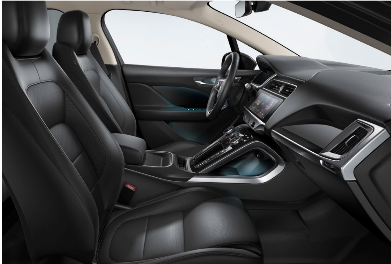
ABGEBILDETES FAHRZEUG: I-PACE S / AUSTRIA EDITION MIT SONDERAUSSTATTUNG