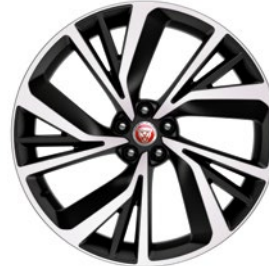
22" MIT 5 DOPPELSPEICHEN GLOSS DARK GREY CONTRAST DIAMOND TURNED (STYLE 5056)