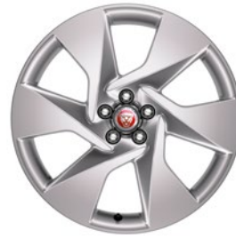
20" MIT 6 SPEICHEN GLOSS SPARKLE SILVER (STYLE 6007)