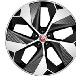
22" MIT 5 SPEICHEN GLOSS BLACK CONTRAST DIAMOND TURNED CARBON INSERTS (STYLE 5069)