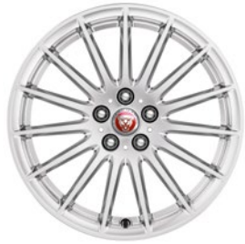
18" MIT 15 SPEICHEN GLOSS SPARKLE SILVER (STYLE 1022)