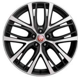
20" MIT 5 DOPPELSPEICHEN POLISHED TECHNICAL GREY (STYLE 5070)