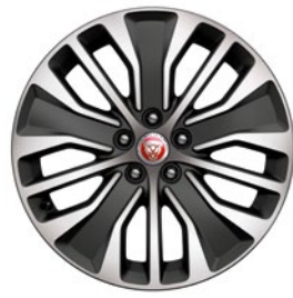
18" MIT 5 DOPPELSPEICHEN GLOSS DARK GREY CONTRAST DIAMOND TURNED (STYLE 5055)