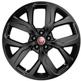
20" MIT 5 SPEICHEN, GLOSS BLACK (STYLE 5068)