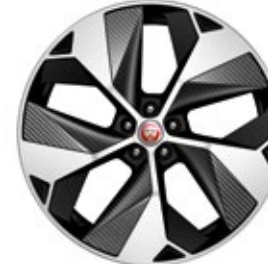
22" MIT 5 SPEICHEN, GLOSS BLACK, DIAMOND TURNED, CARBON INSERTS (STYLE 5069)