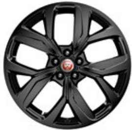
20" MIT 5 SPEICHEN, GLOSS BLACK (STYLE 5068)