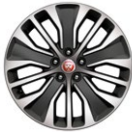
18" MIT 5 DOPPELSPEICHEN, DIAMOND TURNED (STYLE 5055)