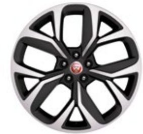
20" MIT 5 SPEICHEN, DIAMOND TURNED (STYLE 5068) Serienausstattung für I-PACE HSE