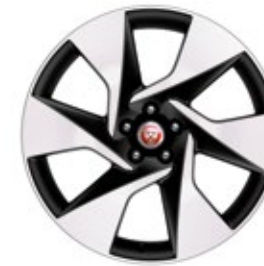
20" MIT 6 SPEICHEN, DIAMOND TURNED (STYLE 6007)