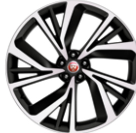
22" MIT 5 DOPPELSPEICHEN, DIAMOND TURNED (STYLE 5056)