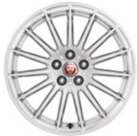
18" MIT 15 SPEICHEN (STYLE 1022) Serienausstattung für I-PACE S