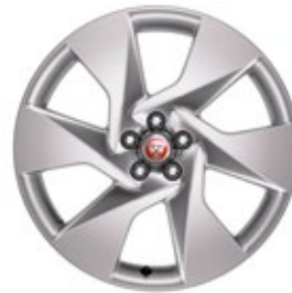
20" MIT 6 SPEICHEN (STYLE 6007) Serienausstattung für I-PACE SE